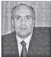
Dolić i Mulalić: Dali posao Đogićima

Iako je iz navedenog teško shvatiti šta je zapravo htio reći, izbjegavajući čak i spominjanje imena, očigledno je da Đogić želi negirati navode o njegovom zapošljavanju u vrijeme dok su I on i supruga Elma bili pristalice ta-