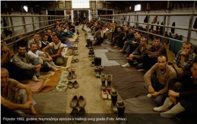
Prijedor 1992. godine: Najmračnija epizoda u historiji ovog grada

Prijedor će danas vratiti sjećanje na najsuroviji dio povijesti grada, kada je 31. maja 1992. godine tadašnja vlast SDS-a, "potkovana" snagom tzv. JNA, naredila svim nesrbima da na rukave stave bijele trake, a na prozore izvide bijele zastave ili plahte.