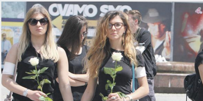
Bijele trake će se nositi širom svijeta

Bijele trake bile su uvod u monstrozna ubistva, silovanja, pljačke, logore, masovne grobnice, nemilosrdna protjeravanja Bošnjaka i Hrvata iz svojih domova.