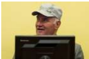
Mladić: U dobroj mjeri i senilan

Autor A. H. | Objavljeno 21.03.2012. u 06:12